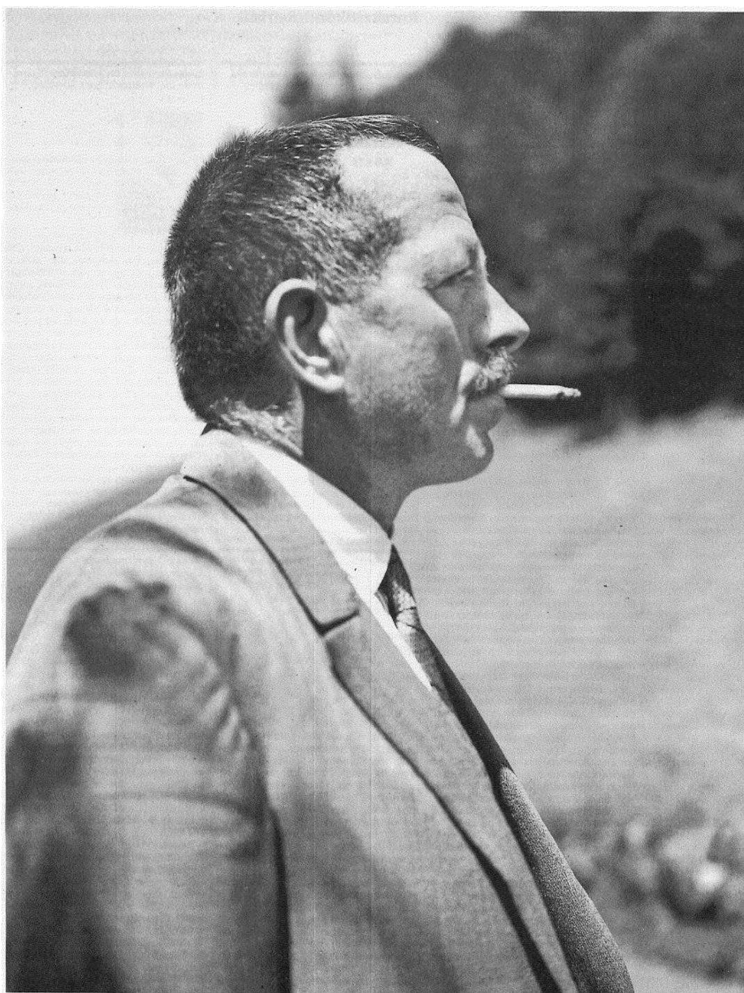
Robert Walser, hier auf einer Aufnahme aus den 1930er-Jahren, schrieb «unheimlich berührende Texte, aber auch manche Albernheiten».